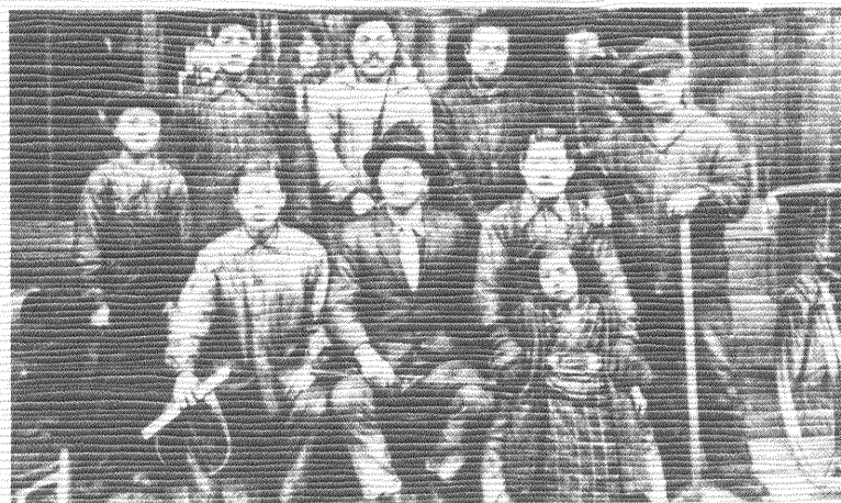
大正6年東京・本所の石原で創業を開始したころの会田鉄工所での写真