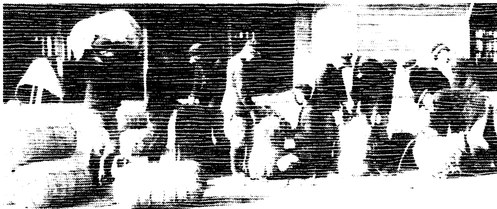
安城農林学校における米の仮実習(大正11年) (『愛知県立安城農林高等学校の歴史』より)

実業教育にはさまざまなものがある。前者「わが国離陸期の実業教育」では「徒弟学校」をとりあげたが、本邦では、より低度で未整備な教育として「実業補習学校」として「中小工業内部の訓練」に重点をおき、初期発足の状況と、その後の展開をフォローし、離陸期における実業教育のあり方を考察する。